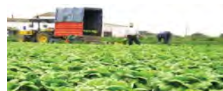
Gasto Público Agropecuario para el desarrollo de Costa Rica Evaluación y marco estratégico para mejorar su eficiencia, eficacia y equidad. Octubre 2011

Su objetivo fue promover una mayor eficiencia y eficacia en la asignación y uso de recursos presupuestarios de las diferentes entidades que conforman el sector en concordancia con la Política de Estado, de manera que se pueda incidir en la toma de decisiones y lograr un sector con mayor crecimiento, competitividad y equidad. Se pretende así potenciar la utilización efectiva del gasto público agropecuario como herramienta gerencial para un mejor direccionamiento de la política sectorial en función de la gestión por resultados.